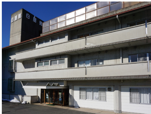
外観 食事 (専任の管理栄養士が食事を管理)