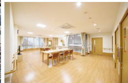
リビング (ユニット)