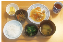
日頃からのお食事