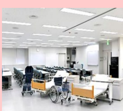
ウィリング横浜 介護実習室